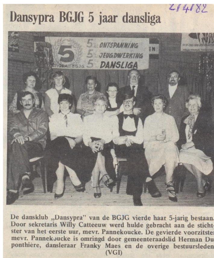
Dansypra viert zijn vijfde verjaardag, 2 april 1982

Eén van de meest succesvolle activiteiten was ongetwijfeld Dansypra, 1976-1990 . Hoe is dat gegroeid?