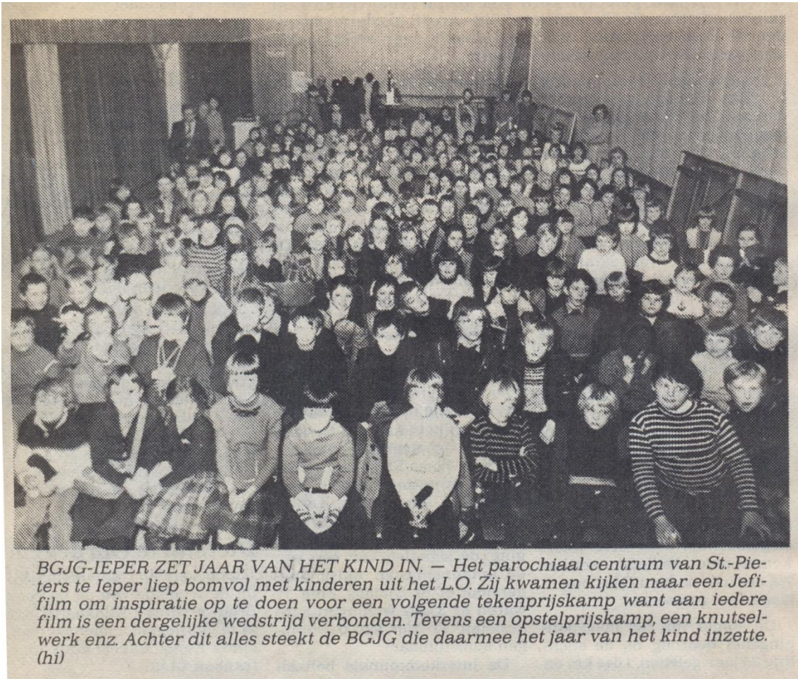
JEFI in de Sint-Catharinazaal, januari 1979

de 16 mm films zeldzaam en werd overgegaan naar video en DVD. De vertoningen gingen dan door in de stadsschouwburg.