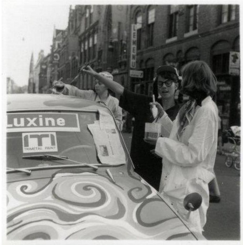
Tooghedagen 1969, Rijselstraat (leper Verbeeldt, inventarisnr. SBE00947)