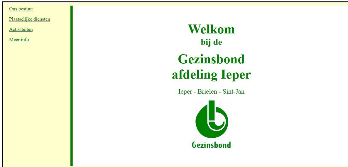
Startpagina van de website van 2002

In 2002 werd een website ontworpen door Johan Beun. Hij beheerde die website tot in 2018 toen vanuit Brussel een algemene website opgelegd werd die voor alle afdelingen dezelfde is. De afdelingen kunnen daarop hun activiteiten aankondigen, foto's zetten en hun diensten en bestuur kenbaar maken. Ook de gewestelijke en landelijke zaken worden vanuit het gewest of Brussel op de site gezet.