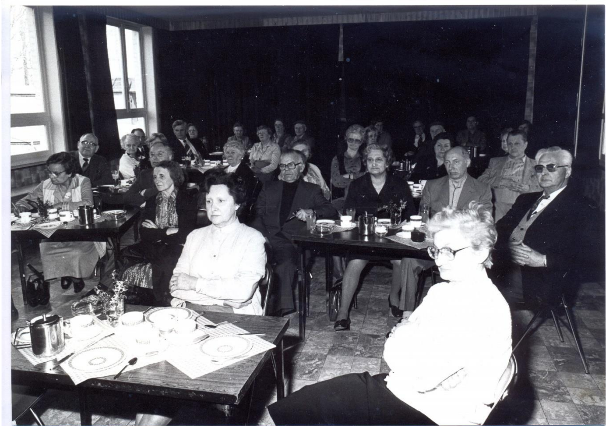
GOA feest in de zaal van het Jeugdstadion, 1982