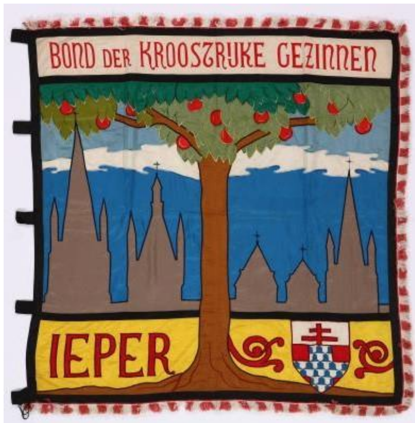
De Bondsflag, 1954 (Ieperse collecties, BAN 182)

Die vlag heeft dan 2.000 F gekost en de eerste vlagdrager werd ons bestuurslid Aloïs Dewaele, vader van 11 kinderen. Dit was zeker een hoogtepunt in het bestaan en de geschiedenis van onze BOND, die op dat ogenblik praktisch een halve eeuw jong was. Later volgden nog vlaggen in Geluveld in 1965 en Vlamertinge en Zuidschote in 1967.