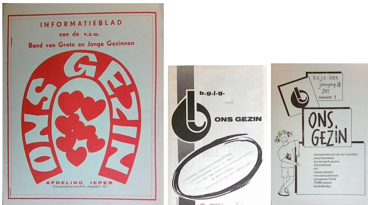
Ons Gezin, 1980, 1984 en 2001